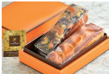
パウンドケーキ(小) ナッツ&オレンジ