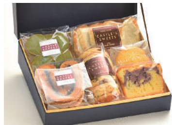
ホテルメイドスイーツ 詰め合わせ I