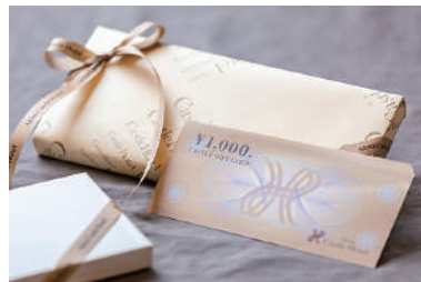
秋田キャッスルホテル商品券