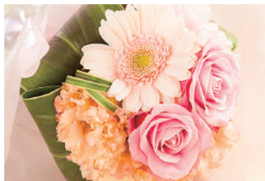
花束／アレンジメント