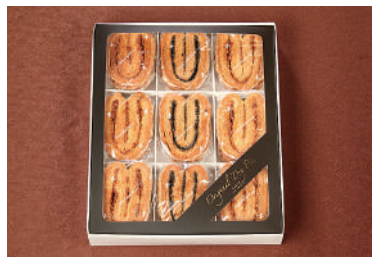
ドライパイ(27枚入り)