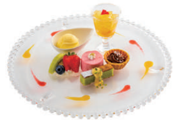
スイーツセレクション