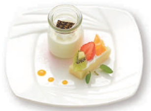
パannaコッタとフルーツケーキ

(表示価格は消費税・サービス料込) ●表示価格はおひとり様の価格です ●器が変更になる場合がございます