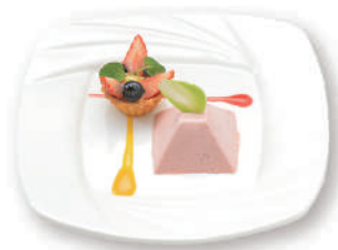
苺のムースとベリータルト