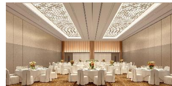
▲1/3に区切った小宴会スタイル