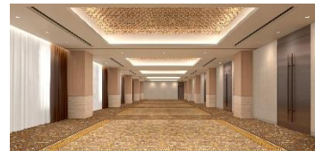
▲ホワイエ ※掲載写真は全てイメージ

写真提供のご案内 3/24以降に、実際の会場写真を以下よりダウンロードいただけます。 https://link.directcloud.jp/rYEkP138vN （パスワード D4X4HM97 公開期間 3/24～4/30）